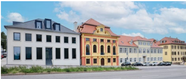
Höfe am Kaffeeberg, Ludwigsburg: Neubau von 40 Wohneinheiten und Denkmalsanierung, Verkauf 2019.

Seit 2008 wurden über 540 Wohneinheiten im Neubau und in der Sanierung durch Einzel- und Globalverkauf realisiert. Zudem verwaltet die Gruppe einen Bestand aus Wohn- und Gewerbeimmobilien.