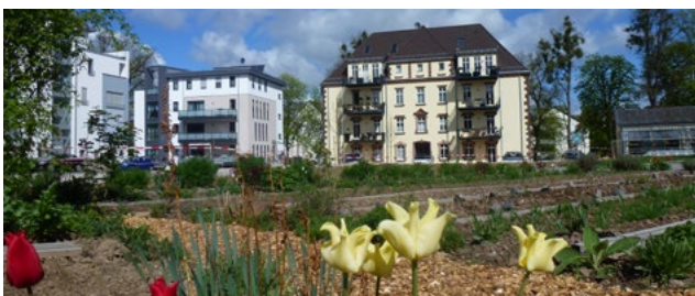
Konversion Jägerkaserne, Kassel: Ehemaliges Kasernengelände, Neubau/Sanierung von 81 Wohnungen, Verkauf 2011 - 2014.