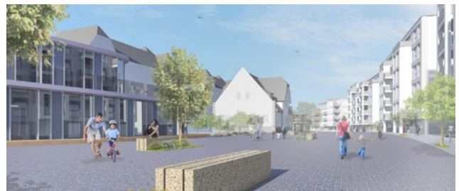
Park Schönfeld Carree, Kassel: fejlesztési terv kb. 450 lakóegységre. Értékesítés 2020-ban.