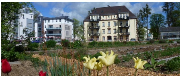
Jägerkaserne átalakítás, Kassel: egykori laktanya területe, 81 lakás új építése/felújítása, értékesítés 2011–2014.