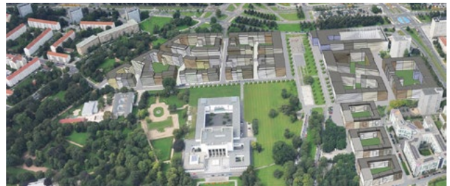
Lingner Altstadtgarten, Drezda: fejlesztési terv kb. 3000 egységre, értékesítés 2019-ben.